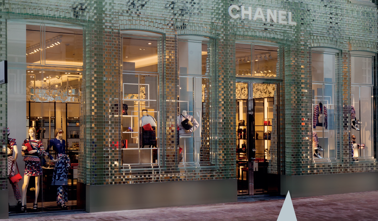
Crystal Houses Amsterdam